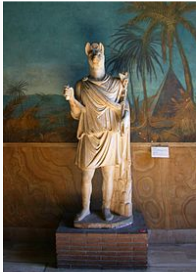
Hermanubis. Museo Vaticano.

Anubis era el antiguo dios de la Duat. Anubis estaba relacionado no sólo con la muerte, también con la resurrección después de ella, y era pintado en color negro, color que representa la fertilidad.